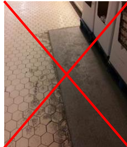
nicht geeigneter Bodenbelag