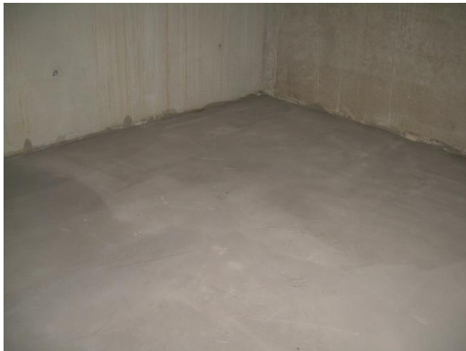
glatter, geeigneter Untergrund aus Betonestrich

Als Untergrund eignen sich asphaltierte und betonierete Flächen sowie ein gegossener Estrichboden. Der Untergrund muss eben, fest, trocken, sauber und frei von Verschmutzungen und Rissen sein, die das Verkleben beeinträchtigen können.