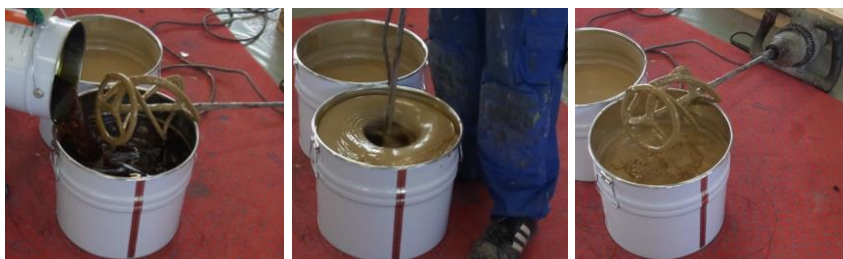
Anrühren des 2-Komponenten PU-Klebers

Der Bodenbelag wird in Rollen geliefert, welche 1-2 Tage bei einer Temperatur von 15°C bis 25°C zur Akklimatisierung dort gelagert werden müssen, wo sie verlegt werden sollen. Am Vortag der Installation den Bodenbelag lose ausrollen damit sich die einzelnen Bahnen entspannen. Vor der Installation sind die beiden Komponenten des Klebers zu mischen. Den gesamten Klebereimerinhalt direkt nach dem Mischen gleichmäßig auf die vorbereitete Installationsfläche gießen (ca. 0,7 kg/m 2 bei SPORTEC 700 2K-PU Kleber ) so dass keine Kleberreste im Eimer zurückbleiben.