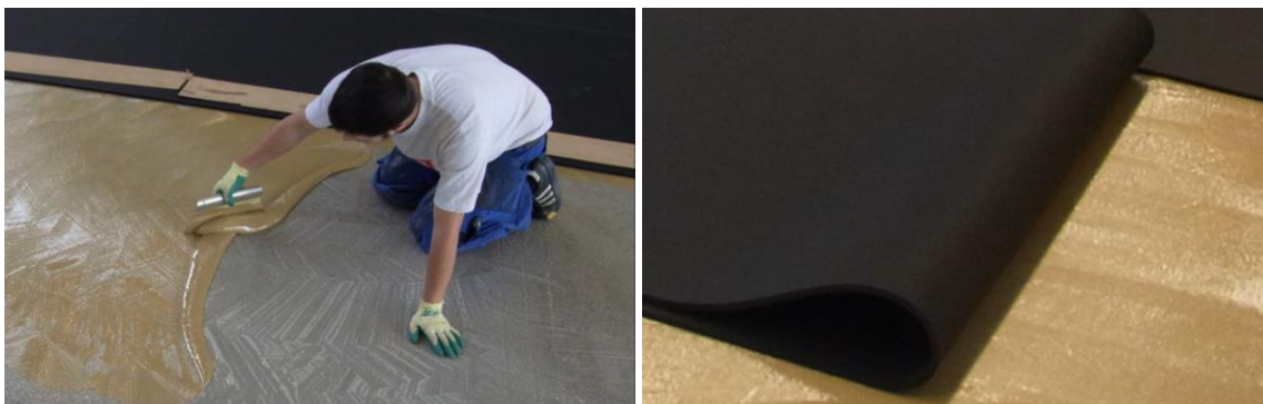
Kleberauftrag auf den sauberen Untergrund; ausrollen der Bahnen in das Kleberbett

Den Kleber mit einem Zahnpachtel gleichmäßig auf der Fläche verteilen auf der die Rolle ausgelegt wird. Für die Verlegung von SPORTEC® standard ist ein geeigneter 2-Komponenten Polyurethan Kleber (z. B. SPORTEC 700 2K-PU Kleber) und ein Zahnpachtel mit der vom Kleberhersteller empfohlenen Zahnung zu verwenden. Anschließend wird die Rolle in das Kleberbett ausgerollt. Hierbei die Ablüftzeit / Setzzeit des verwendeten Klebers beachten.